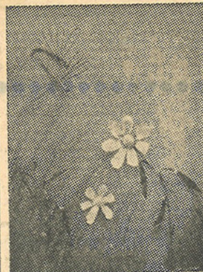
E. Campana «L'approccio» - composizione